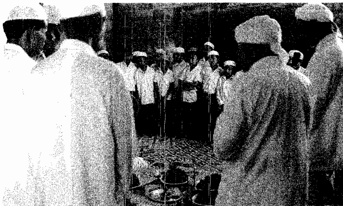
บรรยายภาพ:กิจกรรมการถ่ายภาพวิถีชีวิตของชุมชนแก่เด็กและเยาวชน

4.9 เปิดโอกาสให้เด็กนักเรียนประเมินผลตนเอง ครู และการบริหารของโรงเรียนด้วย